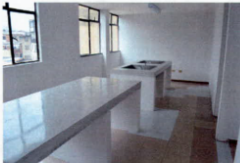
Vista Exterior e Interior de la antigua sede de la Alcaldía de Mártires Cra. 19 No. 23-90 Barrio Santa Fe

2.2 Es materia de cuestionamiento que la Administración después de seis años continúe pagando arrendamiento para el funcionamiento de la sede de la Alcaldía Local de Mártires, con ocasión de lo cual se han cancelado más de $1.333 millones, incluidas las adecuaciones locativas; sin ocuparse de otra alternativa menos gravosa a los intereses patrimoniales del D. C., máxime si se tiene en cuenta el elevado costo del arrendamiento que mes a mes paga por valor superior a los $20 millones