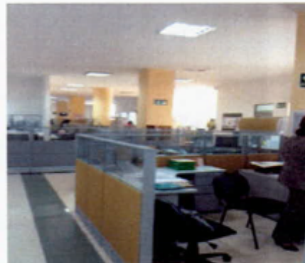
Sede en arriendo de la Alcaldía Local de Mártires – Fondo de Desarrollo Local.

Los señalados hechos informan de una clara ineficiencia administrativa, en atención a que la citada Alcaldía no tiene sede propia no porque no existan predios para el efecto, dado que por ejemplo, el Fondo de Desarrollo Local de Mártires tiene varios inmuebles, entre ellos los ubicados en la Calle 24 No. 27 A – 25 y en la Calle 24 No. 27 A – 31, en los cuales como es de conocimiento de la misma Secretaría Distrital de Gobierno y de conformidad con el cuadro de uso del suelo consultado en el SINU – POT, la actividad de la Alcaldía Local se encuentra permitida, según lo corroboran las correspondientes Fichas Técnicas de los señalados inmuebles.